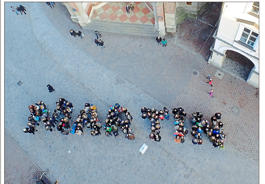
Die Jugendlichen bildeten den Schriftzug „Martin“ vor der Martinskirche.

In einem Workshop wurde ein Song entwickelt, den die Evangelische Jugend Landshut beim Songcontest „Luther rockt“ einreichen wird. In einem anderen Workshop sind aktuelle Thesen für die Aktion „Reformation reloaded“ entstanden. Am 1. Juli um 17 Uhr werden an vielen verschiedenen Orten in Bayern 95 jugendpolitische Forderungen als neuer „Thesenanschlag“ sichtbar werden. Auch die Evangelische Jugend Landshut wird sich an dieser Aktion beteiligen.